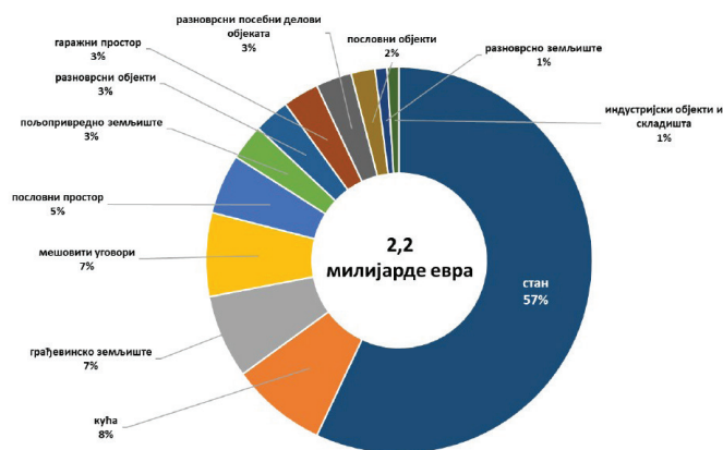
Удео вредности тржишта непокретности према врстама/подврстама непокретности за четврти квартал 2024. године